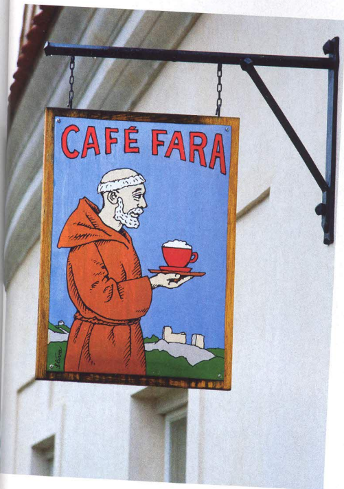
Mnich s šálkem kávy, jehož autorem je Jiří Slíva, se stal logem podniku

Komorní prostor vybavený starožitným a masivním stylovým nábytkem vytváří dojem, že nejste v kavárně, ale že jste přišli k někomu domů